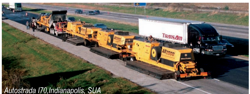
Autostrada I70, Indianapolis, SUA

G i dYf'5bgUa V' i`dYbhf i`FYWJW'Uh` 5F&$$$gY'VUnYUn`dY'c'hY\bc`c! [JY'VfYjYhUh`WUfY'ghUV]`Y hY'bcj` ghUbXUfXY`dYbhf i`fYWJW`UfYU UgZU`h`i`i`j`dY`d`Ub`a cbXJU`"