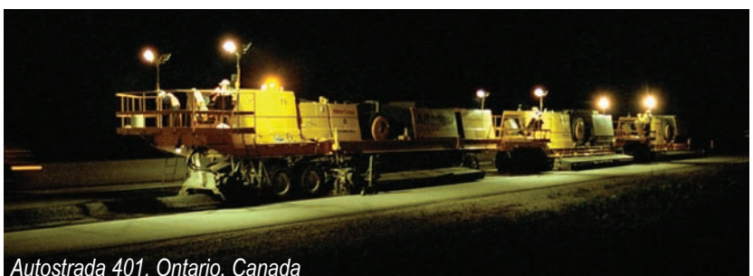
Autostrada 401, Ontario, Canada

G i dYf'5bgUa V' i`dYbhf i` FYWJW'Uh`5F&$$$fYdfYn]bh` W\]bhYgYb U'hY\bc`c][J]`cf`XY` fYWJW`UfY`U`UgZU`h`i`i`j`U`WU`X` Jb`g]h`i`z`X]b`d`i`bWh`XY`j`YXYfY`U` Jbc`j`U`][J]`cf`hY\bc]WYz`U`YÜW]Yb`Yj` Wcgh`i`f]`cf`j`U`UgdYWhY`cf`Ywc! `c][JWY`"