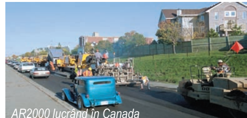
AR2000 lucrând în Canada