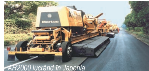
AR2000 lucrând în Japonia