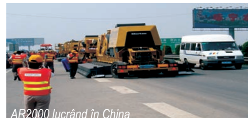
AR2000 lucrând în China