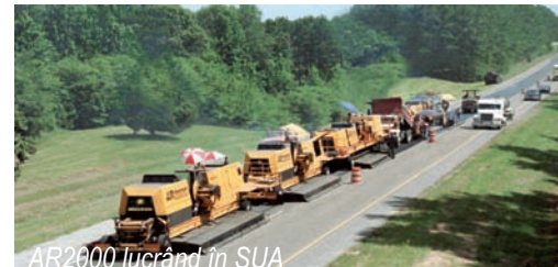
AR2000 lucrând în SUA