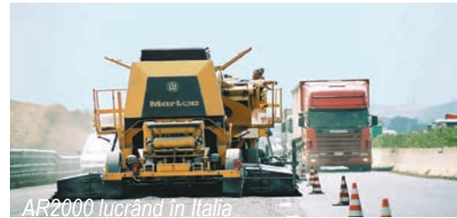
AR2000 lucrând în Italia

Cele trei unități principale ale Super Ansamblului pentru Reciclat AR2000 pot fi ușor tractate de autocamioane și transportate între localitățile diferitelor proiecte în regimul de viteză caracteristic autostrăzilor.