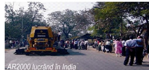
AR2000 lucrând în India