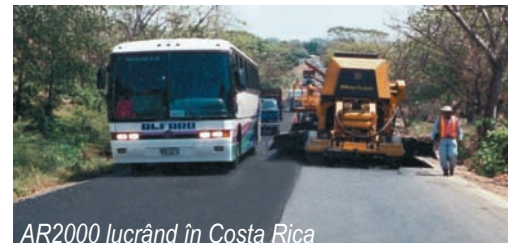
AR2000 lucrând în Costa Rica