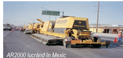
AR2000 lucrând în Mexic