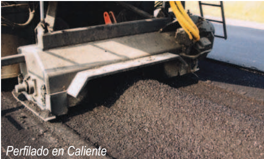
Perfilado en Caliente

Desde la mezcladora, el material completamente mezclado es transferido a la tolva de una pavimentadora convencional para su distribución. La compactación es realizada por compactadoras convencionales de llantas de hule y vibradoras.