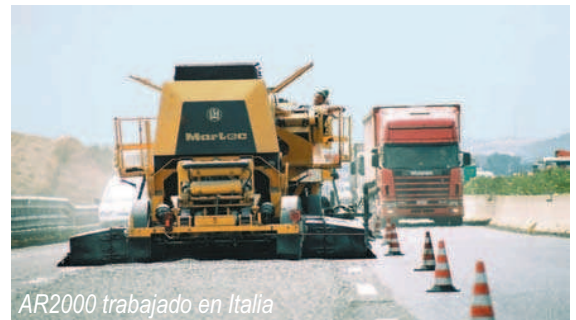
AR2000 trabajando en Italia

Las tres unidades principales de la Súper Recicladora AR2000 pueden ser fácilmente conectadas a tractores y transportadas entre los sitios de trabajo, a velocidades normales en carreteras.