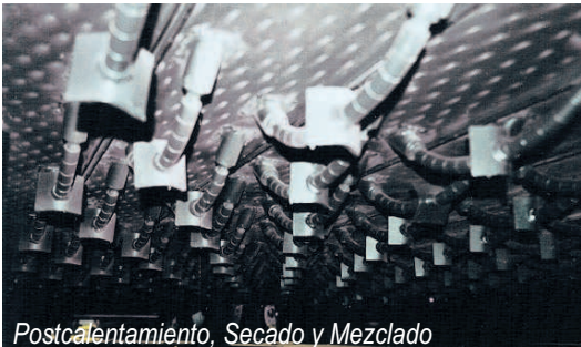
Postcalentamiento, Secado y Mezclado

El reciclaje en sitio en caliente de asfalto puede ser ahora realizado de manera segura en cualquier lugar del mundo.