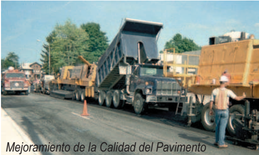
Mejoramiento de la Calidad del Pavimento

La Súper Recicladora AR2000 ha sido diseñada y fabricada para operar prácticamente libre de emisiones.