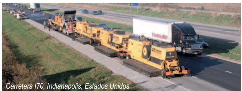
Carretera 170, Indianapolis, Estados Unidos

La Súper Recicladora AR2000 y el proceso patentado de Martec están marcando alrededor del mundo nuevos estándares para el reciclaje en sitio en caliente de asfalto.