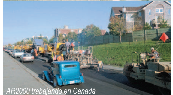
AR2000 trabajando en Canadá