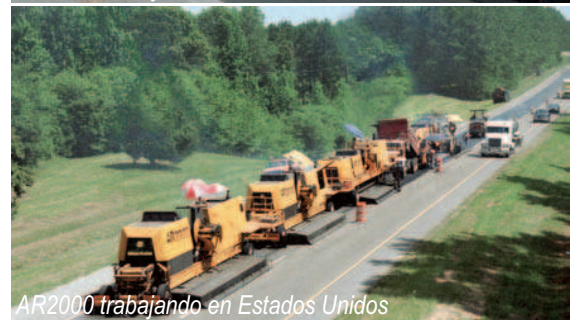
AR2000 trabajando en Estados Unidos