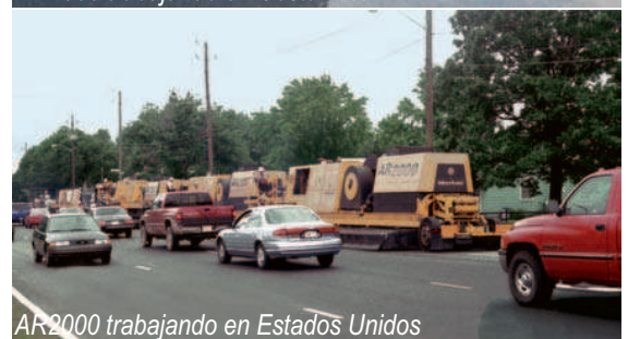
AR2000 trabajando en Estados Unidos