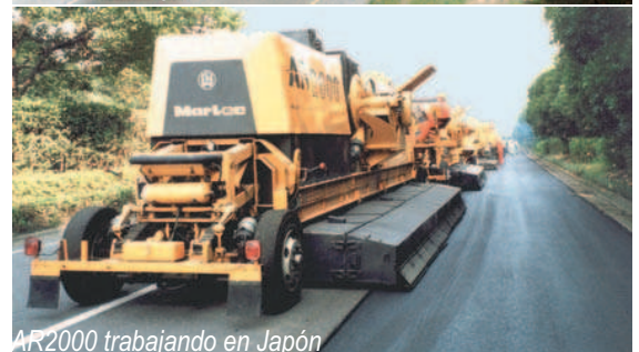
AR2000 trabajando en Japón