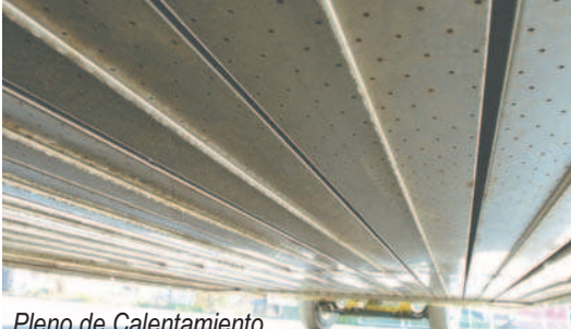
Pleno de Calentamiento

Con el objetivo de satisfacer las especificaciones de calidad del pavimento requeridas por el cliente, materiales correctivos como agentes rejuvenecedores que mejoran las propiedades ligantes del asfalto y mezclas adicionales o materiales agregados que son usados para corrección y actualización estructural, pueden ser añadidos al pavimento asfáltico reciclado. Cualquier combinación de éstos materiales correctivos pueden ser añadidos según se requiera, monitoreando y controlando con precisión su volumen y su tasa de adición, por medio de un sistema electrónico incorporado a bordo.