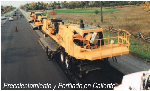
Precalentamiento y Perfilado en Caliente

El material reciclado y el material correctivo, que han alcanzado la temperatura deseada, son recogidos desde la superficie del pavimento por una transportadora de arrastre y transferida a una mezcladora de doble eje de 200 tph de capacidad. La calidad del producto final es asegurada cuando el material reciclado y el material agregado son mezclados profundamente en ésta mezcladora de alta capacidad.