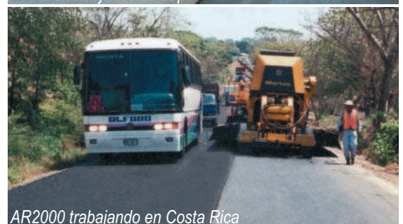
AR2000 trabajando en Costa Rica