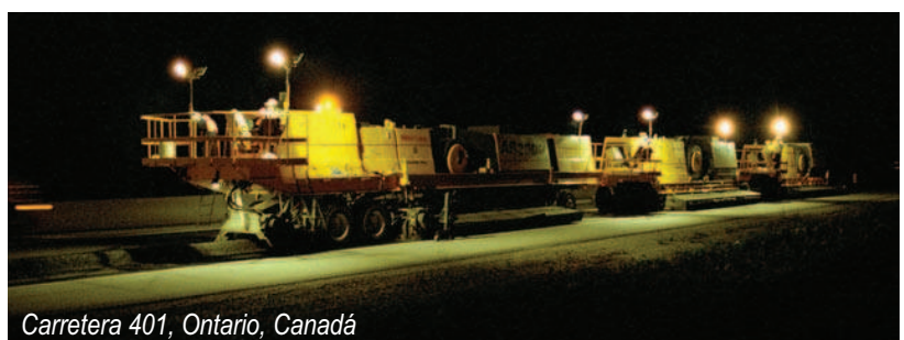
Carretera 401, Ontario, Canadá

La Súper Recicladora AR2000 es la última innovación para obtener los beneficios ambientales, técnicos y económicos del reciclaje en sitio en caliente de asfalto.